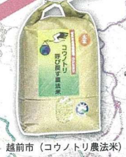
越前市 (コウノトリ農法米)