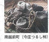
南越前町 (今庄つるし柿)