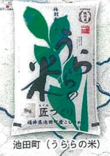
池田町 (うららの米)