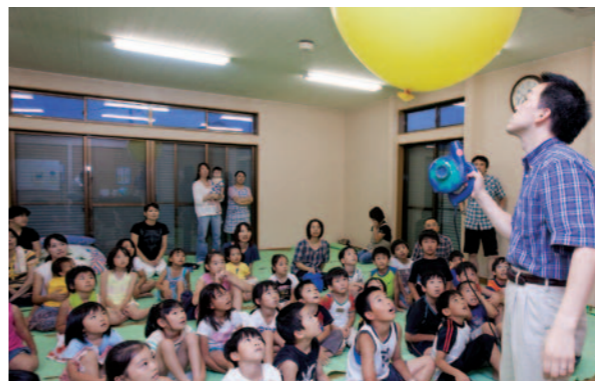
地域サイエンス博士などによる楽しい実験が行われる「ふくいサイエンス寺子屋」

— 体力面でも立派な成績を収めましたね。 知事 「全国体力・運動能力、運動習慣等調査」で、2年連続で全国トップという素晴らしい成績を収めています。放課後に楽しく体を動かす機会を提供する独自の事業などを今後も継続し、平均的な力、そして全国大会などの代表選手の力の両方を底上げしていきたいと思っています。