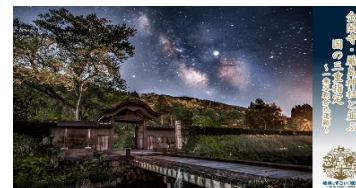
一乗谷朝倉氏遺跡唐門 バーチャル背景