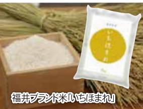
福井ブランド米「いもほまれ」