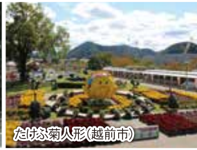
たけお菊人形(越前町)