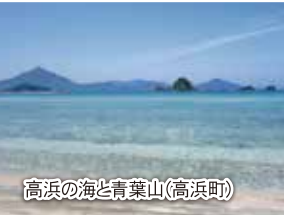
高浜の海と青葉山(高浜町)