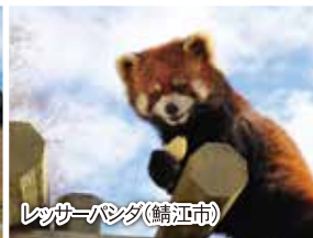
レッサーパンダ(鯖江市)