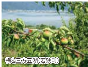
梅と三方五湖(若狭町)