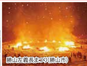
勝山左義長まつり(勝山市)