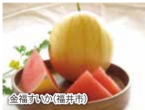
金福すいか(福井市)