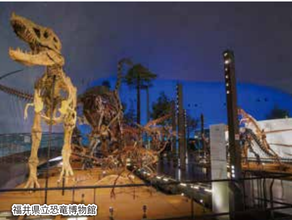
福井県立恐竜博物館