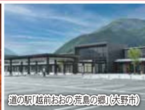
道の駅「越前おおの荒島の郷」(伏野市)