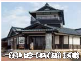
一筆啓上 日本一短い手紙の館 (坂井市)