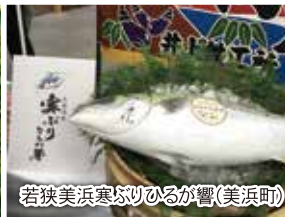
若狭美浜寒ぶりひるが響(美浜町)