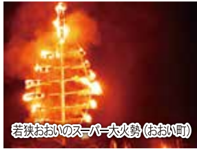
若狭おおいのスーパー大火勢(おおい町)