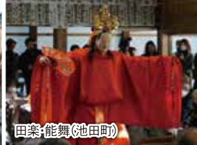
田楽・能舞(池田町)