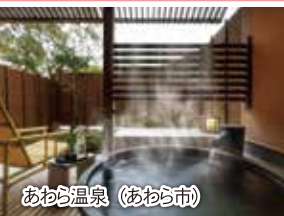
あわら温泉 (あわら市)