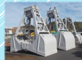
各種グラブバケット