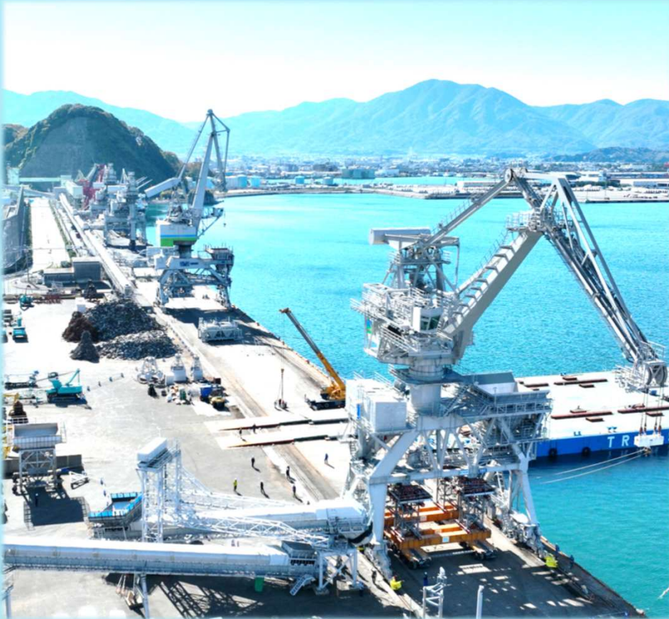
台船からの陸揚げ状況（令和7年11月16日撮影）