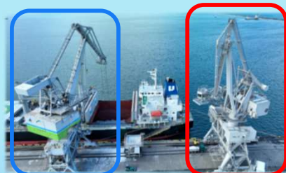
既設クレーン (1号機)