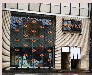
小売店舗の外観整備