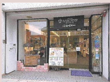
体験用施設を導入した宝飾・時計店