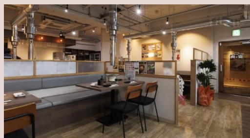
空き店舗を改装してオープンした飲食店