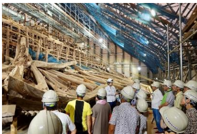
修理現場特別公開（西福寺）