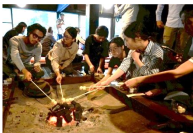
茅イベントは囲炉裏でお団子も