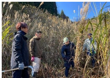
茅刈り研修会（南越前町）