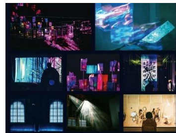
大安禅寺デジタルアート