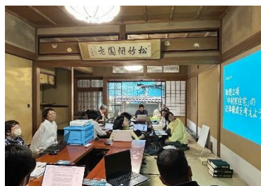
Wikipedia タウン in 重文中村家