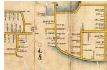
7月展示「福井藩家中絵図」山内秋郎家文書(1858年)

家族で楽しみながら県の歴史を学べる企画展示や月替わりで様々な収蔵資料を紹介する展示を行っています。