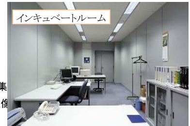
インキュベートルーム