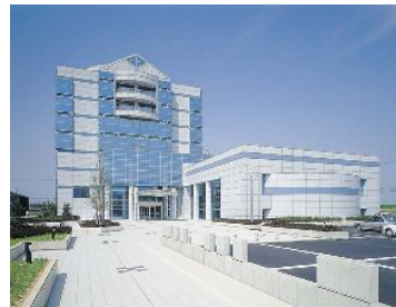
(産業情報センター正面)