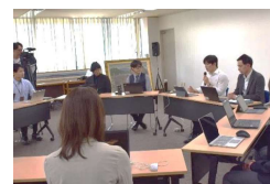
【若者躍動プロジェクトチーム会議】