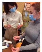
【外国企業との商談(イメージ)】

県内企業と外国企業との国内商談会を開催 ノウハウを持つ人材によるサポートや効果的なツールの活用を支援 [補助率] 1/3 [補助上限額] 50万円 海外展示会への出展を支援 [補助率] 1/3 [補助上限額] 100万円