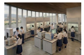
【高度分析・実験室(イメージ)】