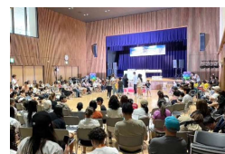
【親子交流イベント(イメージ)】

〔民間団体の地域子育てサポート活動を応援(1団体あたり最大50万円) 福祉と教育の連携強化に向けた「こども応援円卓会議」の開催〕