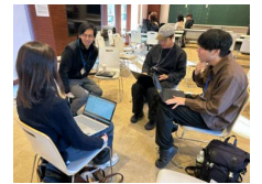
【伴走支援(イメージ)】

ビジネスプランコンテストを開催し、優秀なモデルに奨励金を支給 [奨励金] 200万円~1,000万円 成長期の事業拡大に意欲的な企業を、資金とノウハウの両面から支援 [補助率] 1/2 [補助上限額]1,000万円 創業を目指す起業家を発掘し、創業前後の伴走支援を実施