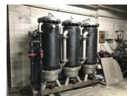
【高性能ボイラ(イメージ)】