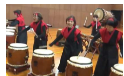
【高齢者のグループ活動(イメージ)】

〔高齢者の生活支援に対するニーズ調査の実施 買い物に対する生活支援サービス(買物代行、送迎、移動販売等)の実証 シニアグループ等の活動を多様なメディアにより発信〕