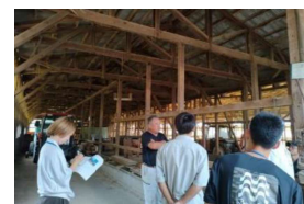
【畜産ジョブツアー】