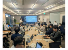
【AX意見交換会(イメージ)】

経営層によるAXコンソーシアム(AI研究の場)の創設 AXに関する講演会、研究会、意見交換会の開催 県内企業とAIスタートアップ企業のマッチングによるAX実証実験