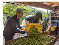
【地域活動の担い手(イメージ)】

〔有識者を講師に迎え、県内自治体・関係者向け研修会を開催 モデルとなるプロジェクトを4市町で実施〕