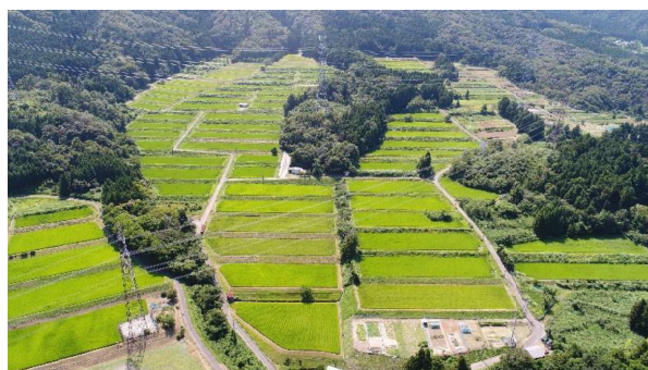
【ほ場整備 美浜新庄地区(美浜町)】154百万円