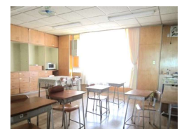
【校内サポートルーム】