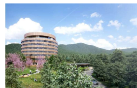
【ホテルイメージ(参考:リゾナーレ福井)】