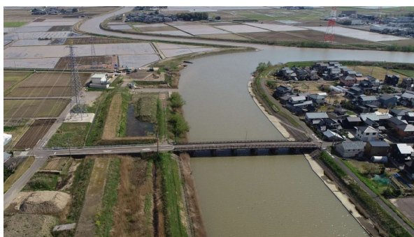
【河川改修 竹田川(あわら市)】103百万円

道路・河川・砂防ダム・港湾の整備 等 ほ場の整備、漁港・治山・農業用施設の整備 等