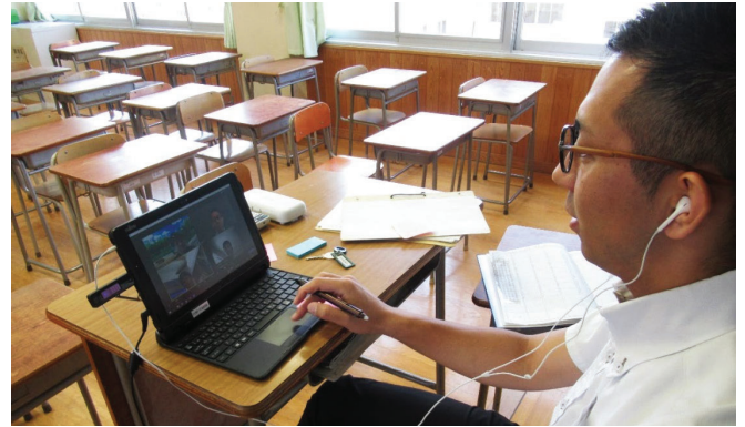
【オンライン授業配信(教職員)】