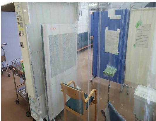
【感染拡大防止対策を施した診察室（イメージ）】