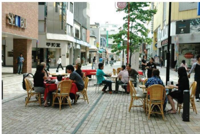
【消費喚起キャンペーンのイメージ】