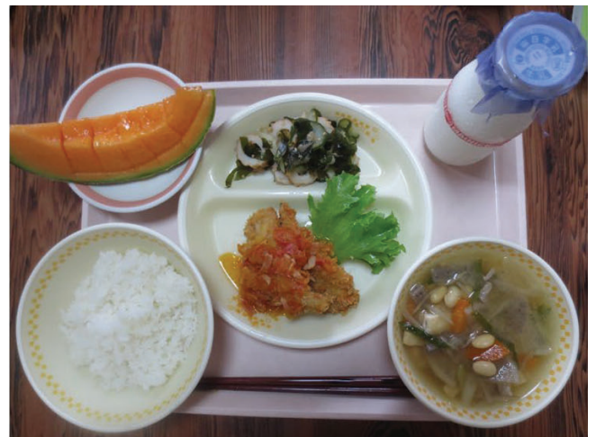
【学校給食(イメージ)】