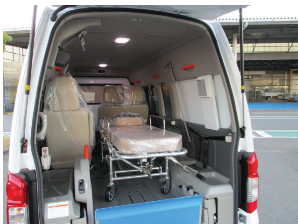
【感染症患者搬送車】