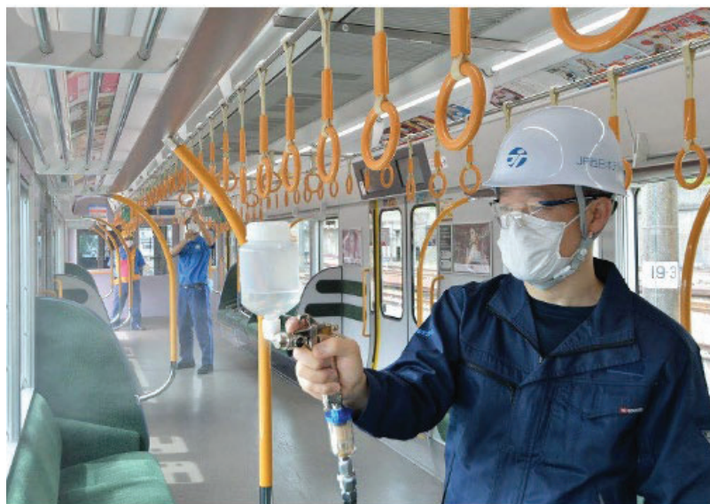
【電車内における抗ウイルス・抗菌加工（イメージ）】