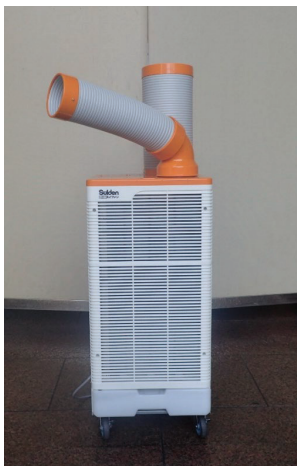
【スポットクーラー】