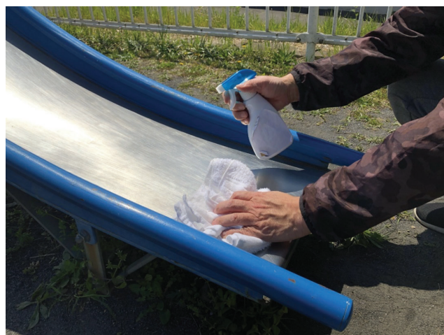
【建物や設備の消毒】