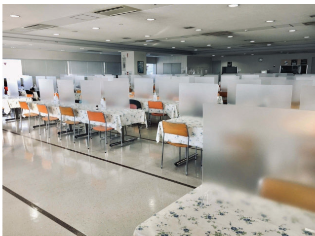
【卓上パーテーションの設置】