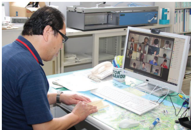
【オンライン授業風景】