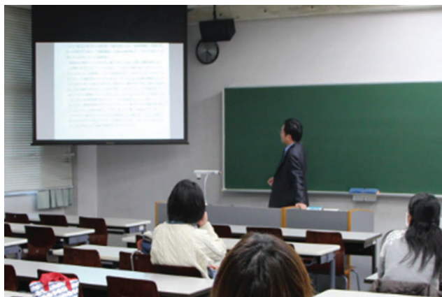
【県立大学授業風景】