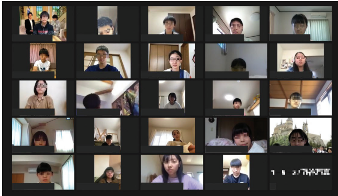
【オンライン学習ツールの画面】