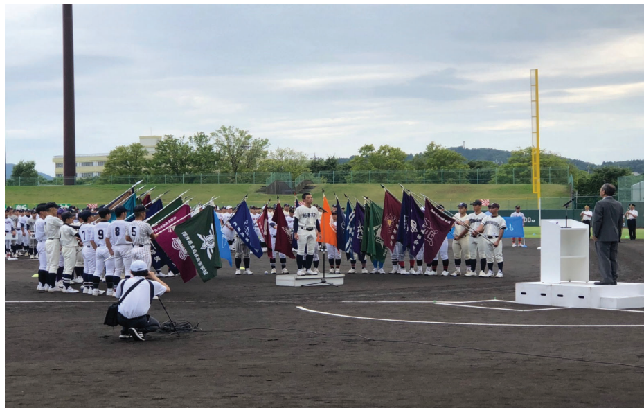
【例：高校野球（福井県営野球場）】