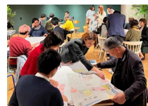
【官民共創によるプロジェクトの企画(イメージ)】

〔 ウェルビーイングに関する研究や実証を行う官民共創の組織の設置 民間の知見等を有するウェルビーイングコーディネーターの配置 (1名⇒2名) 〕