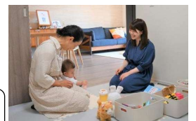
【ふく育さん(イメージ)】