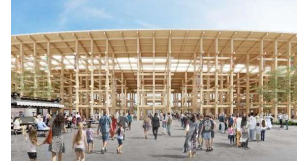
【大阪・関西万博(イメージ)】

〔 県内の全ての小中高の児童・生徒に、入場チケットIDを配布 校外学習で大阪・関西万博を訪問する公立小中学校に、 入場チケットIDを配布 〕