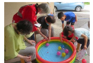
【高齢者によるグループ活動(イメージ)】

〔 生きがいづくりや地域での活動を行うシニアグループを応援 シニア応援文化祭、ふくい健康長寿祭の開催 〕