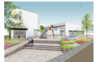
【R6あり方検討会 での外観(イメージ)】

〔 [美術館] 基本計画策定委員会の設置および基本計画の策定 [歴史博物館] 基本的方向性の策定 〕