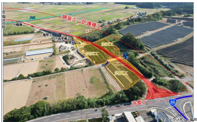
【(国)416号(福井市白方町～布施田町)】714百万円

道路・河川・砂防ダム・港湾の整備 等 ほ場の整備、漁港・治山・農業用施設の整備 等