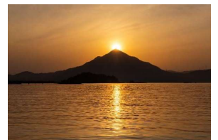
【夕日スポット(イメージ)】

〔 嶺南在住インフルエンサー、観光投資促進コーディネーターの配置 夕日スポット整備の基本構想の策定 等 〕