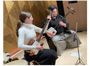
【外国人向け体験コンテンツ】

〔 海外の有名旅行雑誌等による本県のキラーコンテンツ記事の発信 駅観光案内所における旅ナカ情報発信(高輪ゲートウェイ、京都駅) 等 〕