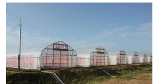
【模擬経営研修ハウス(イメージ)】

〔 [第二ふくい園芸カレッジ(仮称)] 実施設計、研修圃場整備等 [園芸LABOの丘(観光・体験エリア)] 基本構想の策定 〕