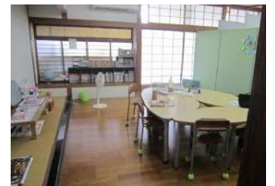
【校内サポートルーム】

〔 支援員のいる校内サポートルーム設置校を拡充 5年度:5校 6年度:50校 7年度:73校 〕