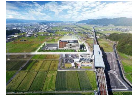
【越前たけふ駅前に新設予定の(株)福井村田製作所の研究開発センター】