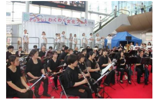
【アートプロジェクトの一例】

〔 専門スタッフを配置し、文化団体に対する相談機能を強化 多様な担い手が取り組むアートプロジェクトに助成金を支給 等 〕