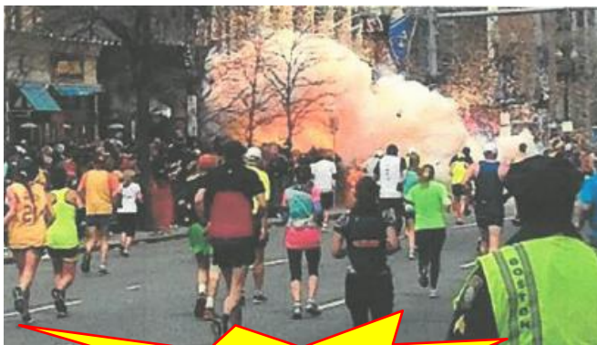
ボストンマラソン爆発事件