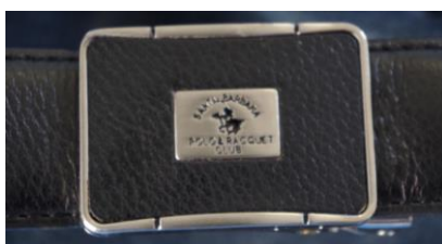
ベルトのバックル