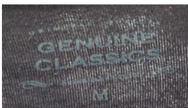
紺色長袖ハイネックシャツの襟首表示