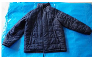
黒色ダウンジャケット