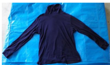
紺色長袖ハイネックシャツ