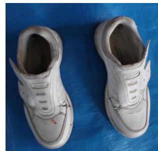
白色スニーカー(ダンロップ)