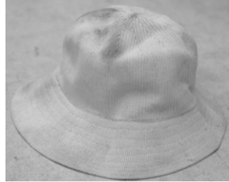
ピンク色あごひも付き帽子