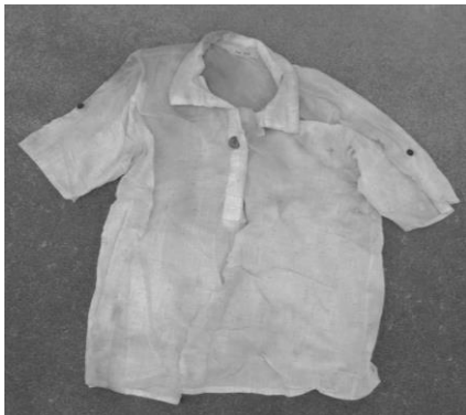
ピンク色半袖ポロシャツ