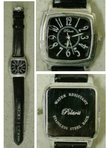
腕時計(Polaris、黒革ベルト)