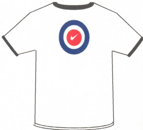
ナイキ製白色Tシャツ