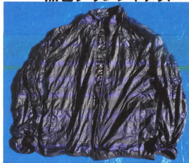
黒色ダウンジャケット