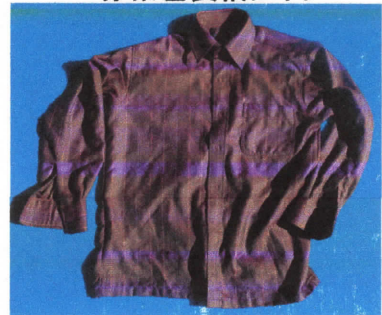
赤茶色長袖シャツ