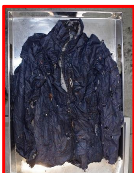
ジャンパー(紺色、タグ「G-STAR、Mサイズ」)