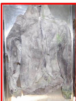
ジャージ上衣(白色、タグ「FRED PERRY、XSサイズ」)