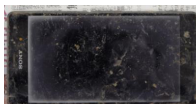
スマートフォン(ソニー製、黒色、ソフトバンク)