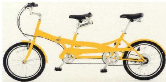
※ 二人乗り用タンDEM自転車