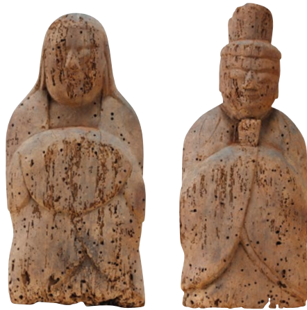
男・女神坐像 福井市東河原町 八幡神社