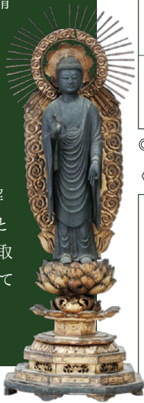
阿弥陀如来立像 勝山市比島 比島道場

展示では姿なき神の「すがた」を映した神像や神社に祀られた仏像を中心に、福井県嶺北地方の鎮守さまの歴史と思想を読み解きたいと思います。また、神社とともに、浄土真宗の道場についても取り上げ、集落の信仰について考えてみたいと思います。