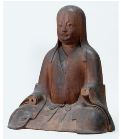
女神坐像 坂井市三国町安島 大湊神社